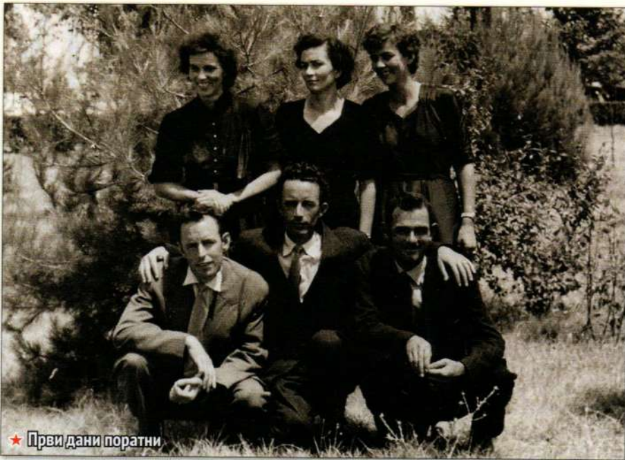
★ Први дани поратни

Мјесец дана је ношен од положаја до положаја док није преминуо у Дубочкама у Бањанима.