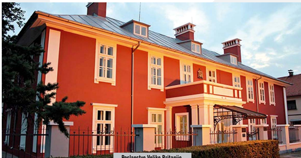
Poslanstvo Velike Britanije

Zgrada poslanstva Velike Britanije sagrađena je 1913. godine, u neposrednoj blizini prestolonasljednikovog dvorca. Stilski nalik na engleske ljetnjikovce, sa zatvorenim trijemom iznad kog je balkon, videnicama na krovu, asocira na romantičarsku arhitekturu, za koju je najvjerovatnije glavni „krivac” engleski arhitekta Harti. Enterijer odiše jednostavnošću, u skladu sa praktičnim nacionalnim duhom Engleza, dok je bogata bašta u ljetnjim mjesecima bila poprište za rješavanje važnih diplomatskih pitanja na prijemima, uz zvuke malog orkestra, dok se služio škotski viski i domaće crmničko vino.