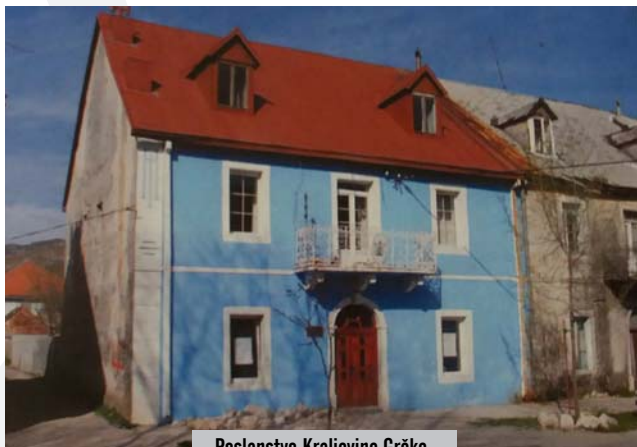
Poslanstvo Kraljevine Grčke

Knjaževina/Kraljevina Crna Gora je imala uspostavljene međudržavne odnose sa Belgijom koja na Cetinju nije imala svoje Poslanstvo (Le-