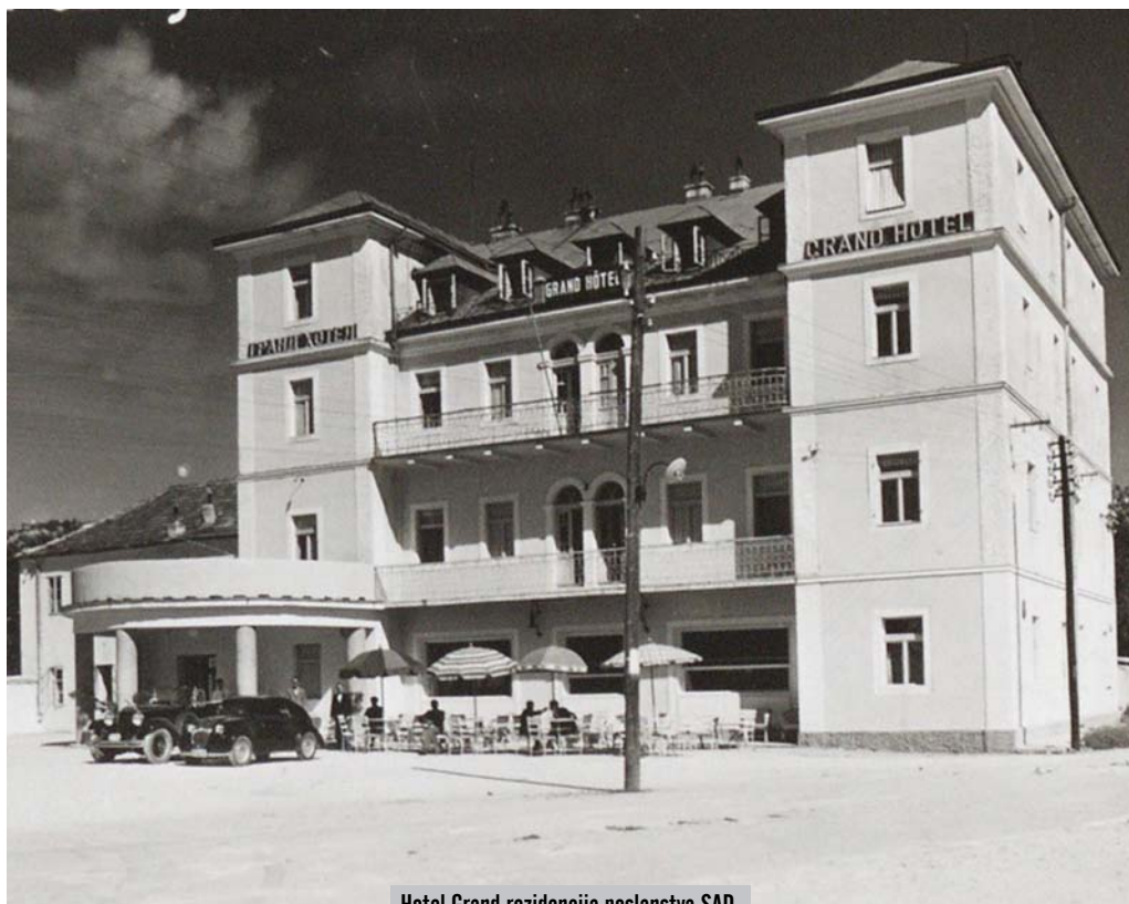
Hotel Grand rezidencija poslanstva SAD