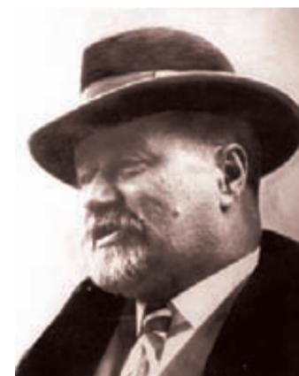
Hrvatski političar Stjepan Radić

Poprsje indijanskog poglavice Jolače iz države Vašington jedno je od najcijenjenijih djela Janka Brajovića. Prvi put je predstavljeno javnosti na izložbi britanske Kraljevske akademije umjetnosti. Sada se nalazi u zbirci galerije Tejt u Londonu i može se vidjeti samo uz specijalnu dozvolu. Posljednji put bilo je javno izloženo u toj galeriji 2004. godine na čuvenoj izložbi "Glava uz glavu" kada je izloženo 40 najboljih bisti na svijetu