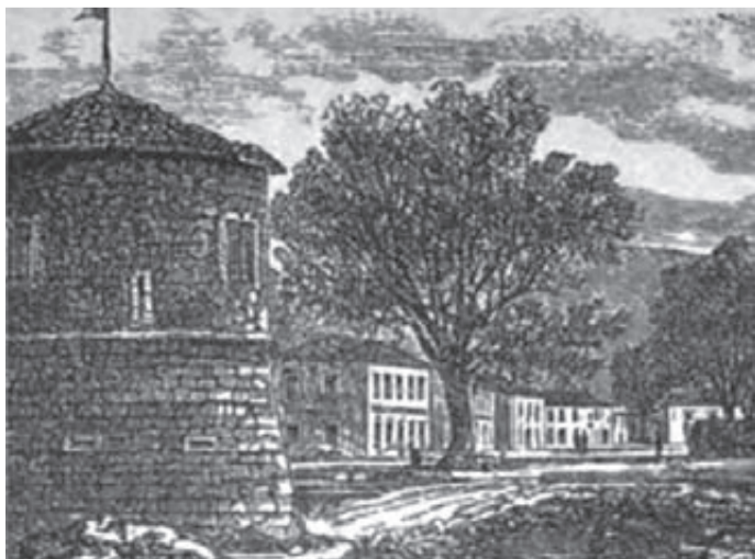
Istorijski brijest pored Biljarde, crtež

ve Biljarde, tu od naroda poštovanu sudnicu pod otvorenim nebom u središtu crnogorske prijestonice. Pošećeno je u inat tradiciji i pozitivnom odnosu naroda prema stablu koje je bilo vitalan simbol nacionalnog identiteta Crnogoraca i pod kojim se sastajao i sudio Senat, a knjaz Nikola srijetao sa narodom, svojim podanicima i strancima da bi razmatrao važna javna pitanja, ali i individualne molbe i žalbe. Zatim, rušenje Njegoševih stare kapele na Lovčenu i izgradnja nove kapele sa pečatom kralja Aleksandra Karađorđevića, zabrana nošenja crnogorske kape sa tradicionalnim obilježjima i namećanje na njima simbola sa 4 oca, sa četiri ćirilica slova na glavi kao simbolični dokaz potpune dominacije nove ideologije nad crnogorskom nacionalnom svijesti. Ponižavajući odnos prema crnogorskoj ratnoj zastavi, alaj barjaku. Ukidanje Crnogorske crkve i tortura prema svještenicima koji nisu prihvatili srpsku crkvu kao novi vjerski autoritet. Pritisak i zahtjev novih učitelja da daci u školama u Crnoj Gori moraju govoriti ekavicu... Sve nabrojano samo su neki od primjera metode udara na kolektivno pamćenje crnogorskog naroda