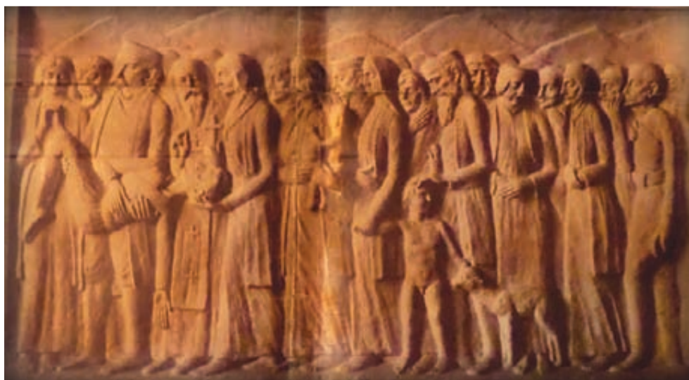
Brajovićev reljef Zbjeg