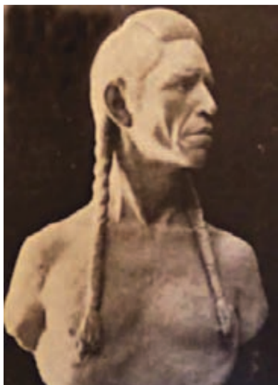
Poprsje indijanskog poglavice Jolače