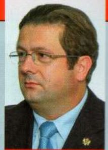
Пише: Ненад Стевовић